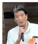
なごみ の会 の 紹 介